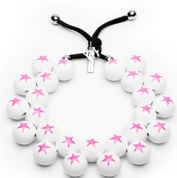
● Fucsia Fluo