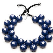
● Blu Marlin stelle bianche