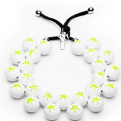
● Giallo Fluo