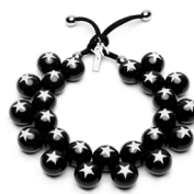
● Nera stelle bianche