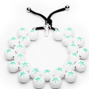
● Verde Elettrico