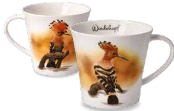
Wiedehopf Hoopoe Huppe fasciée

9,5 cm • 0,35 l 22.001000.0.225.1 • VE2 38-473-30-1