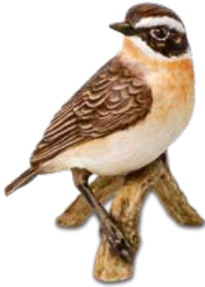
Braunkehlchen Whinchat Tarier des près

9 cm 23.002000.0.225.9 • VE1 38-473-35-1