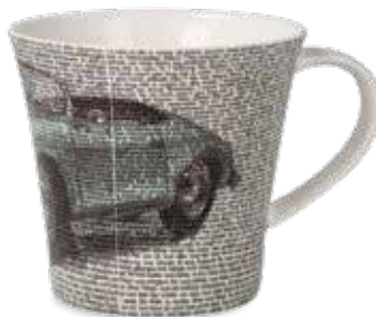
Porsche 356 Auratium Green 9,5 cm · 0,35 l 25.001000.0.584.4 · VE2 23-800-08-1