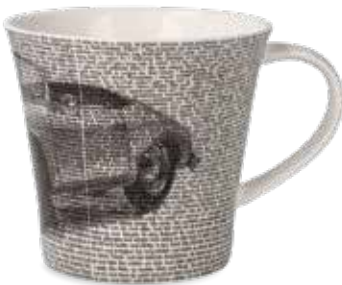
Porsche 356 Black 9,5 cm · 0,35 l 25.001000.0.584.4 · VE2 23-800-07-1