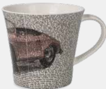
Porsche 356 Rubyred 9,5 cm · 0,35 l 25.001000.0.584.4 · VE2 23-800-10-1