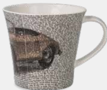
Porsche 356 Orange 9,5 cm · 0,35 l 25.001000.0.584.4 · VE2 23-800-11-1