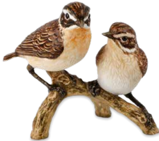
Braunkehlchenpaar Pair of Whinchats Couple de Tarier des près

11 cm 23.003950.0.225.9 • VE1 38-473-34-1