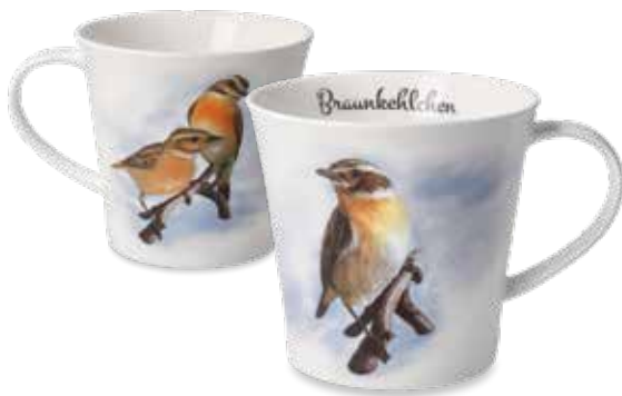
Braunkehlchen Whinchat Tarier des près

9,5 cm • 0,35 l 23.001000.0.225.1 • VE2 38-473-37-1