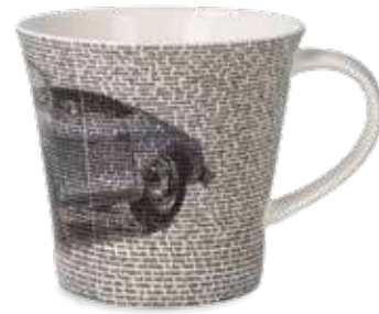
Porsche 356 Aquamarine 9,5 cm · 0,35 l 25.001000.0.584.4 · VE2 23-800-09-1