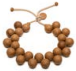
0003 Legno - Bio