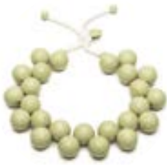
0001 Verde - Bio