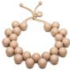
0002 Beige - Bio